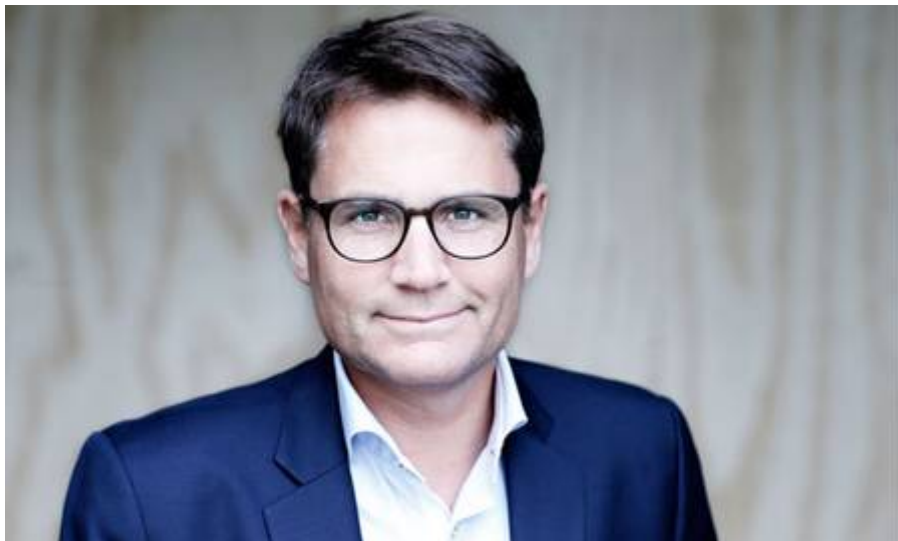
Erhvervsminister Brian Mikkelsen (K).

Efter lange forhandlinger har Folketinget vedtaget en ny betalingslov, som skal skabe fundamentet for nye finansielle services. Loven får generelt ros, men den forudgående politiske proces får kritik for at være rodet, ligesom flere aktører ser uklarheder i loven.